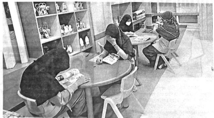
DINAS Perpustakaan dan Kearsipan (DPK) menggagas inovasi Ngabuburit di Pustaka, yakni dengan membuka jam layanan pustaka sampai pukul 17.00 WIB.

"Ini juga salah satu upaya mempertahankan IPLM Padangpanjang yang tertinggi di Provinsi Sumatra Barat berdasar kajian data Perpustakaan Nasional tahun 2021 lalu," terangnya. (sup)