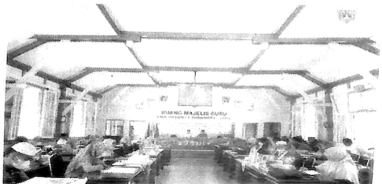
PESANTREN GURU - Guru-guru SMAN 1 Padang Panjang tengah mengikuti Pesantren Ramadan, Sabtu (9/4).

"Setelah diluncurkan Kamis (7/4) lalu bersamaan dengan kelas Mulazamah Tahfizh Alquran bagi siswa, maka hari ini dilaksanakan kegiatan Pesantren for Teacher yang dimulai sejak pukul 08.00 WIB dengan tadarrus bersama Juz 30. Pesantren ini akan dilaksanakan setiap hari sampai 23 April nanti," ungkapnya. (205)