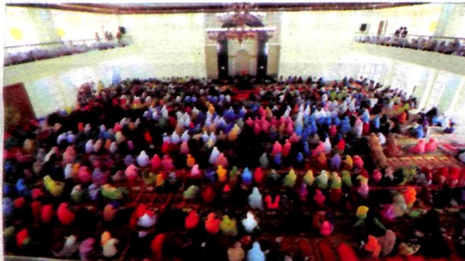
JAMAAH ketika memenuhi ruangan masjid Islamic Center dengan kapasitas 4.000 jamaah.

"Monumen ini diharapkan dapat meningkatkan perekonomian masyarakat sekitarnya, dengan bertambahnya kunjungan wisatawan ke Islamic Centre. Harapan terakhir dari kami, agar monumen dapat dipelihara secara berkala. Karena umur ekonomis monumen ini diperkirakan 20 tahun," harap Zulmawi. (ned)