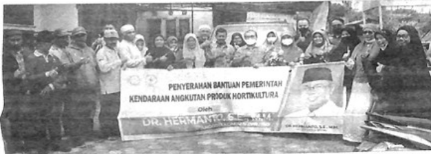
PENYERAHAN bantuan Angkutan Hortikultura yang berasal dari Pokir Anggota DPR-RI Hermanto.

Hermanto yang membidangi pertanian di Komisi IV DPR RI. Hermanto menyampaikan, mobil angkutan hortikultura ini meski untuk satu kelompok tani, nantinya diharapkan bermanfaat untuk masyarakat secara keseluruhan khususnya masyarakat petani. “Kehadiran mobil ini hendaknya bisa meningkatkan produksi pertanian di Kota Padangpanjang, khususnya masyarakat petani yang memproduksi produk hortikultura. Saya berharap mobil ini juga bisa mengkoordinasikan kelompok tani, wabli khusus kelompok wanita tani penghasil