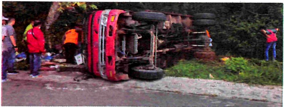
TRUK Pengangkut Sampah milik Dinas Perkim LH Kota Padangpanjang yang terbalik dan mengakibatkan satu orang petugas kebersihan tewas.