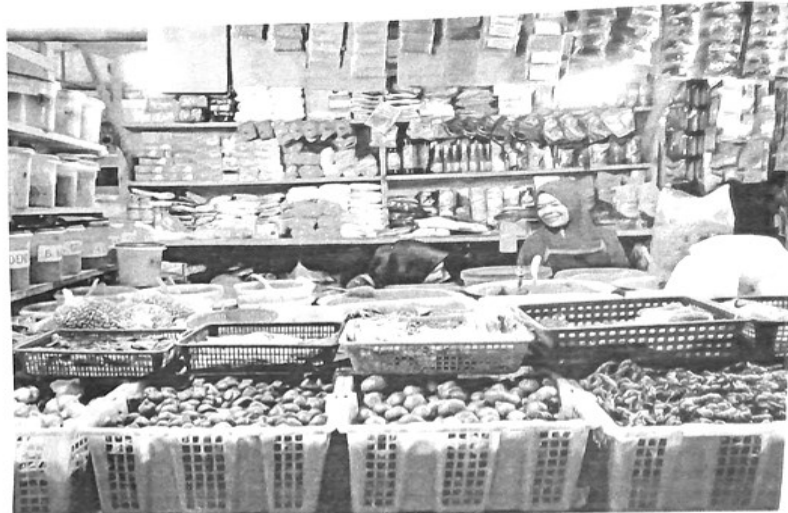
BEBERAPA komoditi pangan strategis alami kenaikan harga pada minggu pertama April.

Di samping itu kenaikan harga juga dipengaruhi naiknya harga gandum yang menjadi bahan baku tepung terigu dan pakan ayam broiler. Khusus untuk ayam broiler juga dipengaruhi kenaikan harga kedelai dunia yang juga merupakan bahan pakan ternak ayam. (sup)