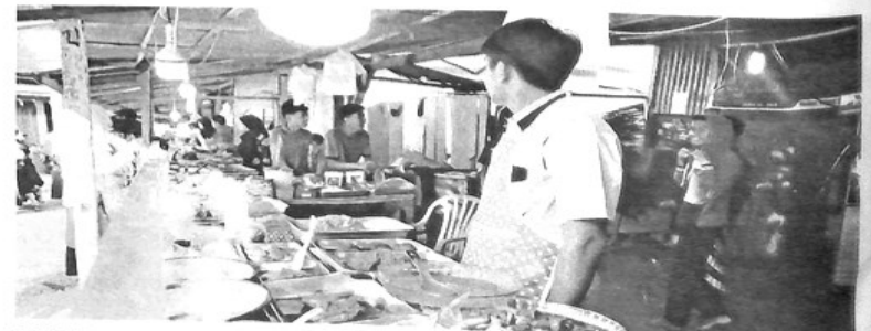
BERAGAM menu yang terdapat di Pasa Pabukoan Tanjung Kelurahan Ganting Kota Padangpanjang. "Saya terbantu sejak adanya Pasar Pabukoan di sini. Pembeli yang datang tidak hanya dari daerah sini, melainkan ada yang datang dari luar," katanya.