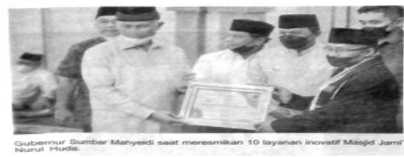
Gubernur Sumbar Mahyeldi saat meresmikan 10 layanan inovatif Masjid Jami' Nurul Huda.

Bangunan masjid berkonstruksi baja ini sangat spesial karena tanpa ada tiang-tiang penyangga di dalam ruangnya, sehingga area dalam masjid terkesan sangat luas. Disamping itu dilengkapi dengan tempat berwudu di sisi utara tempat duduk perempuan dan bagian Selatan masjid tempat duduk laki laki. (*)