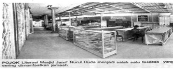
POJOK Literasi Masjid Jami' Nurul Huda menjadi salah satu fasilitas yang sering dimanfaatkan jemaah.