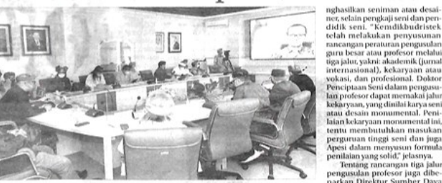
SUASANA Simposium Guru Besar Penciptaan Seni Indonesia yang digelar ISI Denpasar