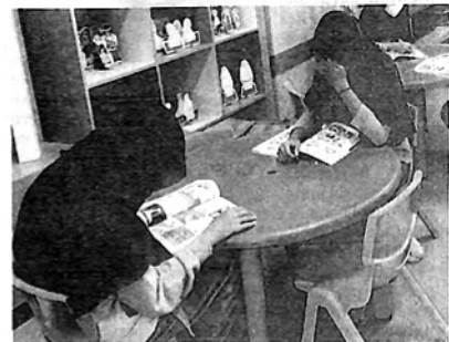
MEMBACA BUKU —Jelang buka puasa, anak-anak membaca buku di perpustakaan.