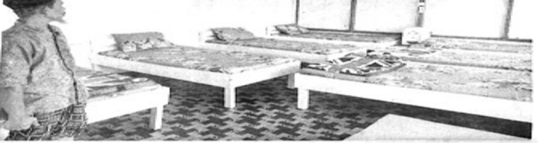
BUASANA ruangan penginapan Masjid Jami' Nurul Huda yang dibuka 24 jam

mulai dibangun sejak 1960-an itu juga dilengkapi dengan perpustakaan terbuka yang bisa dimanfaatkan oleh para pengunjung.