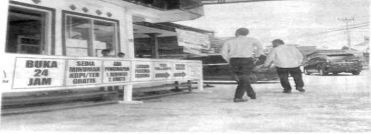
JEMAAH melintas di depan pintu masuk utama Masjid Jami' Nurul Huda