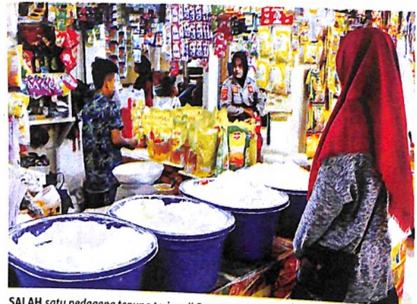
SALAH satu pedagang tepung terigu di Pasar Pusat Padangpanjang. (rom)

Pemerintah Kota Padangpanjang, kata dia, siap melaksanakan kebijakan nasional tersebut dengan sebaik-baiknya. (sup)