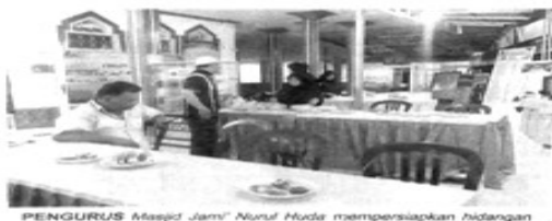
PENGURUS Masjid Jami' Nurul Huda mempersiapkan hidangan terbuka gratis untuk para jemaah.